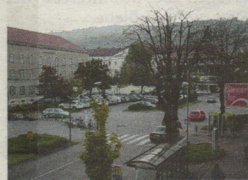
Grünes Licht für die Tiefgarage am Südtirolerplatz vor der Fußgängerzone.